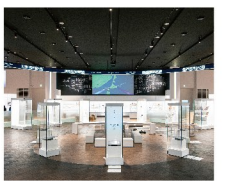
【住所】登別市白老町東町2丁目3 【入場料】大人1,200円、高校生600円、中学生以下無料 【開館時間】9:00~20:00(時期によって変動あり) 【休館日】光復日(祝日または休日の場合は翌日以降) および年末年始(12月29日~1月3日)

<基本理念> 国立アイヌ民族博物館では、先住民族であるアイヌの尊厳を尊重し国内外にアイヌの歴史・文化等に関する正しい認識と理解を促進するとともに、新たなアイヌ文化の創造及び発展に寄与する。 <主な施設> 展示棟 床延面積 8,600㎡ (1)展示室 約2,500㎡ (2)収蔵庫 約1,500㎡ (3)講堂・研究棟 約1,500㎡