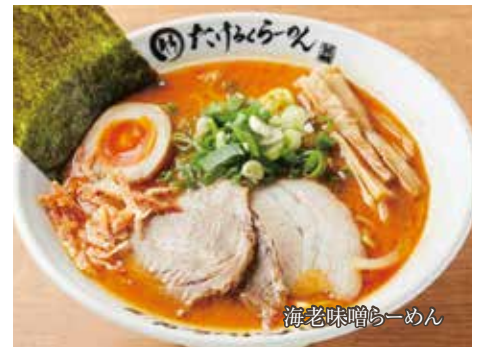
海老味噌らーめん