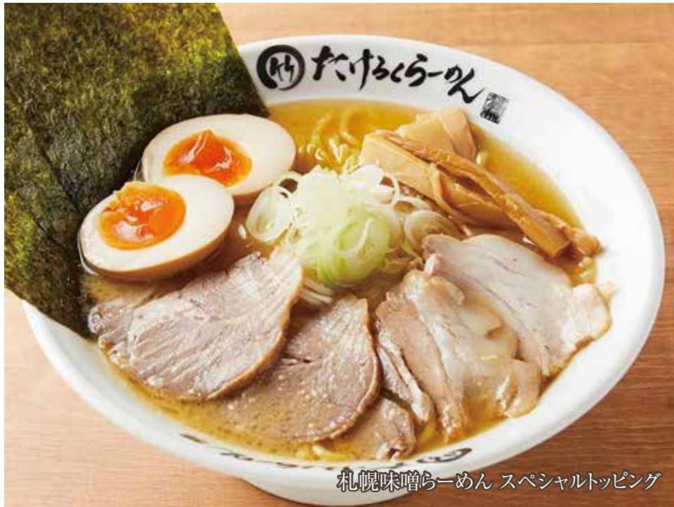
札幌味噌らーめん スペシャルトッピング