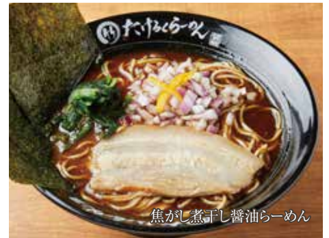
焦がし煮干し醤油らーめん