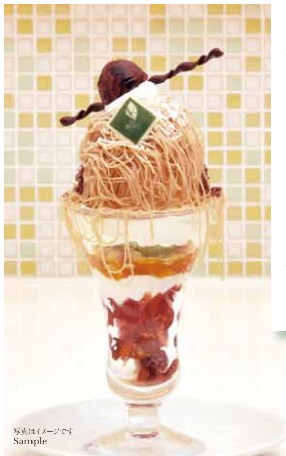
秋 の 味 覚 生 し ぼ り モ ン ブ ラ ン パ フ エ