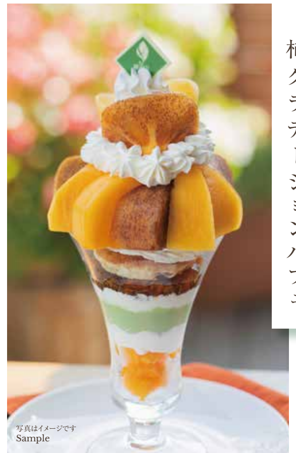
4 種 の 柿 グ ラ デ ー シ ョ ン パ フ エ