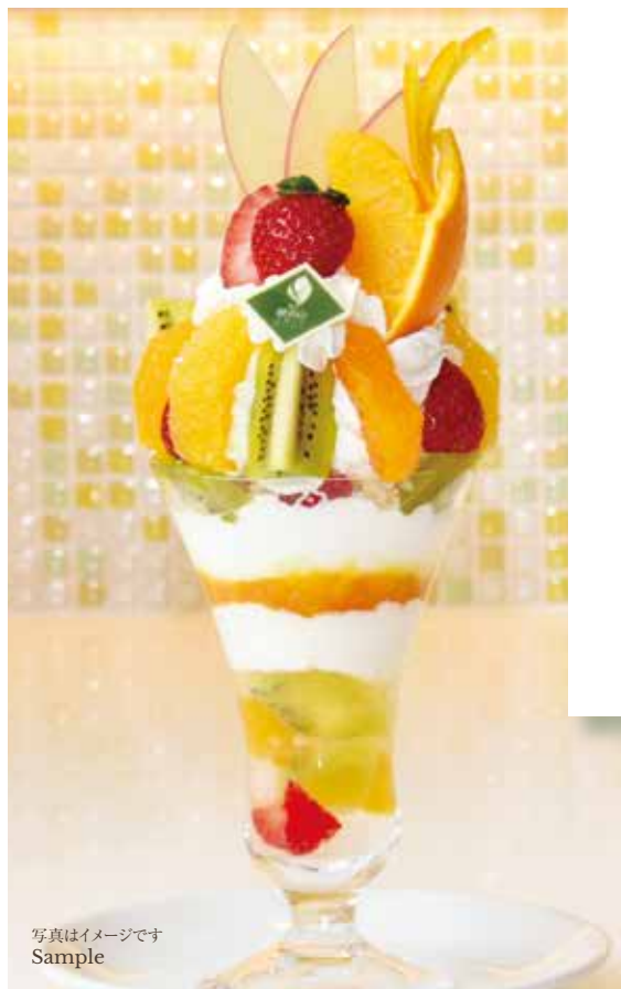
旬 フル ー ツ の 農 園 パ フ エ

09:00~12:00 (L.O. 11:30) 14:00~17:00 (L.O. 16:30)